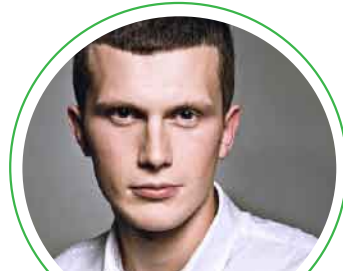
Іус Ігор Богданович, Генеральне консульство України в Любліні, секретар з консульських питань